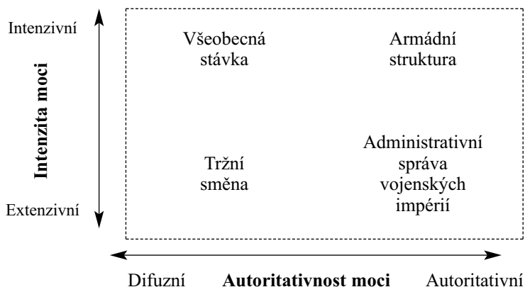
Schéma č. 1 Ideálně typické příklady mocenských sítí na základě charakteru (projevů) moci 7

Sestaveno podle Mann, Michael (1986): The Sources of Social Power. Vol. I.: A History of Power from Beginning to AD 1760 . Cambridge: Cambridge University Press, a dalších textů autora.